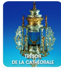
TRÉSOR DE LA CATHÉDRALE